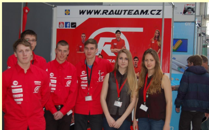
TŘETÍ NA SOUTĚŽI MAKRO CUP PŘEROV 2015