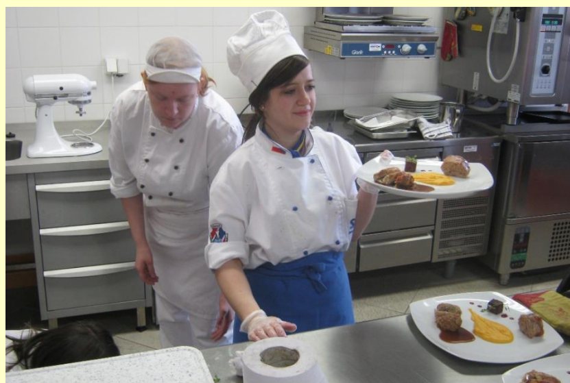
NAŠE ÚSPĚCHY NA JUBILEJNÍM 20. ROČNÍKU GASTRO – HRADEC 2015