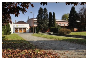
Budova školy, kde probíhá teoretická výuka

Dějiny školy začínají již v roce 1953. Postupem času se měnila vzdělávací nabídka školy.