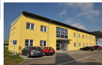
Pracoviště Vsetín - Bobrky

V únoru 2015 došlo k velké modernizaci strojního vybavení tohoto pracoviště.