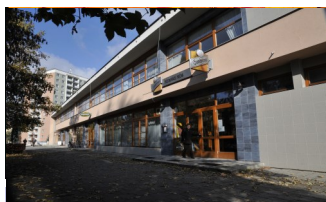
Restaurace Bečva—pracoviště gastro oborů

Výuka učebních oborů probíhá střídáním 1 týden teorie a 1 týden praxe. Odborný výcvik probíhá na odloučených pracovištích.